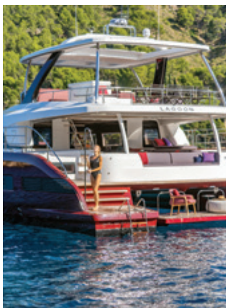
Au mouillage, cette plate-forme se transforme en beach club. Un peu comme si vous aviez emmené de l'autre côté de l'océan la plage du Carlton...

pour la décoration intérieure. Afin de guider la clientèle dans la labyrinthique juxtaposition des essences de bois, tissus, voilages, tapisseries, lingeries et selleries, des atmosphères ont été imaginées, aussi bien pour l'intérieur que pour l'extérieur. Trois finitions bois, chêne clair ou gris et noyer sont accommodables avec des décors préétablis – Nomade, Pure ou Fusion, ainsi qu'une combinaison développée en partenariat avec Sunbrella, parmi les dizaines de références possibles. Le concept 24 heures à bord, inspiré des influences de la lumière et du soleil au cours de la journée, a guidé le choix de cinq ambiances différentes. « Bien sûr, il est