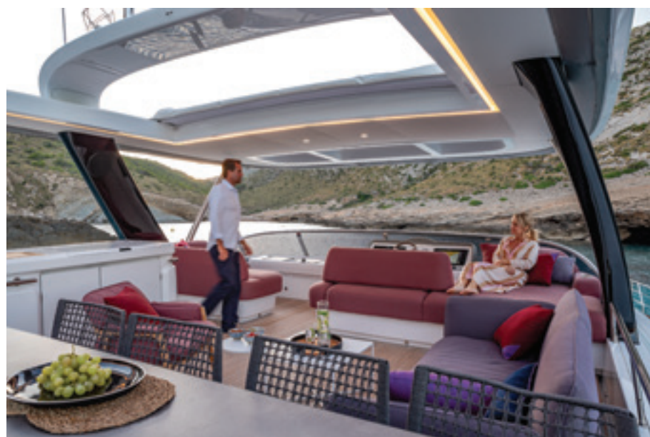
Le flybridge est assez vaste pour organiser des réceptions. Proposé nu en standard, il peut être agrémenté de mobilier « Tribu » ou d'un bain de soleil et de banquettes plus conventionnelles.