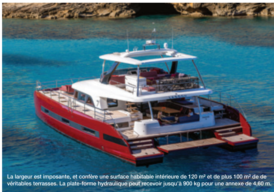
La largeur est imposante, et confère une surface habitable intérieure de 120 m 2 et de plus 100 m 2 de véritables terrasses. La plate-forme hydraulique peut recevoir jusqu'à 900 kg pour une annexe de 4,60 m.

Lors de la production d'un yacht entièrement custom, une grande partie du temps est consacrée au choix des aménagements et aux finitions. Dans ce domaine, l'expérience acquise depuis de longues décennies permet de devancer la demande du client dans la plupart des cas. Ce qui est chronophage dans les ateliers n'est pas le rendu final d'une extrême qualité, mais bien l'incertitude quant à ce rendu, s'il n'est pas prédéterminé. « Mais dans cette